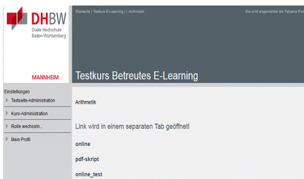
Abbildung 2. Gestaltung der Lernmaterialien in einem Lernmodul

Alle diese Objekte wurden entsprechend der Moodle- Vorgaben eingerichtet.